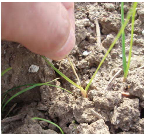
Græs behandlet med Focus Ultra. Bladet i vækstpunktet er misfarvet, og kan nu let trækkes op.

Focus Ultra er meget effektiv mod rajgræs og andre grove græsser*. Hjerteskuddet bliver gulfarvet og slipper fæstet inde i planten. Man kan let trække de nyeste blade op af bladskeden, næsten uden modstand. Den "porrehvide" del får et mat og brunligt skær.